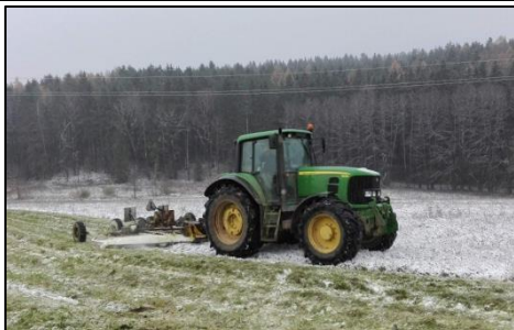
20.11.2017 – první sněhový poprašek a ještě se mulčuje neposekaná tráva